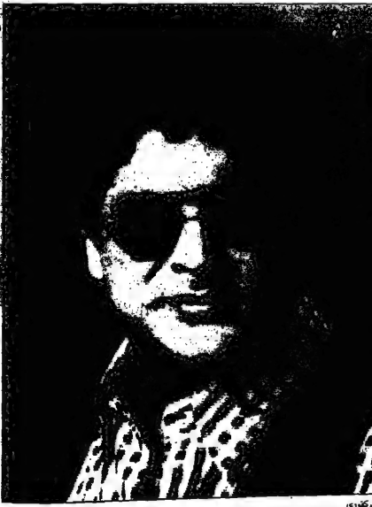
والفنان وائل كفوري

من تكبر ان للفرح اذا كان قادرا على سبب امره... أقول لنوال الزغبى: الاتخيلين من نفسك؟ ولراغب علامة: لماذا تهاجمني؟! الفنان وائل كفوري